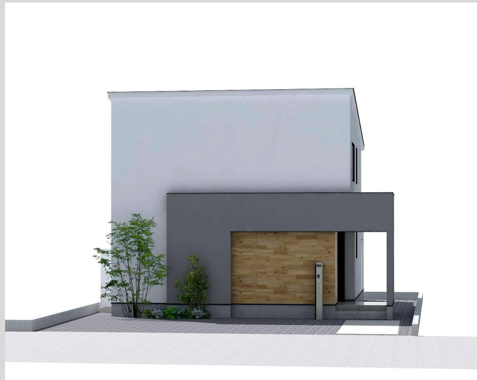
北側外観イメージ