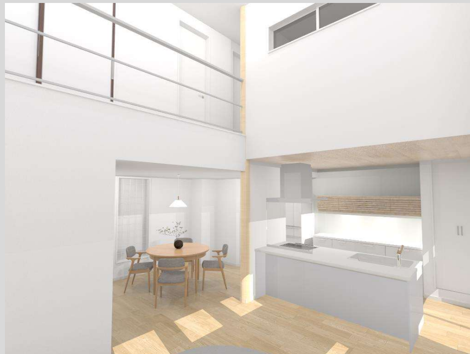
リビングイメージ